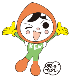
人権イメージキャラクター 人KENまる君